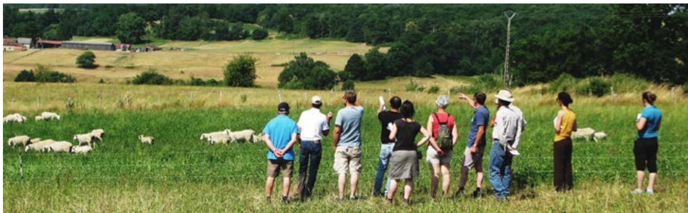
↑ Les pieds dans l'herbe, le GIEE RADITS se réunit régulièrement pour se perfectionner dans la conduite du pâturage et en évaluer les répercussions économiques.